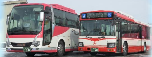
北海道拓殖バス(株)様