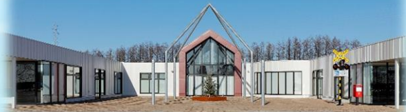
道の駅おとふけ なつぞらのふる里 様