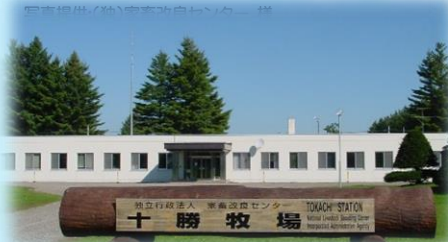
家畜改良センター十勝牧場 様