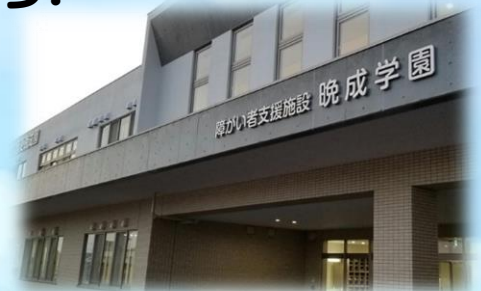
障がい者支援施設 晩成学園 様