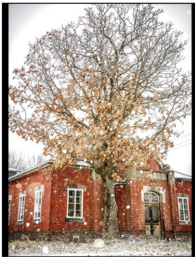
2019年 第7回 最優秀受賞作

好評につき今年もまたフォトコンテストを実施します!! 今回のテーマは「まくべつ再発見」です。幕別の美しい風景を写真で表現してみませんか? フィルムカメラ・デジタルカメラはもちろん、携帯電話で撮影したものでもOKです!! お気軽にご応募下さい。