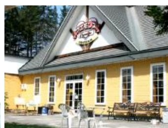
ウエモンズハート