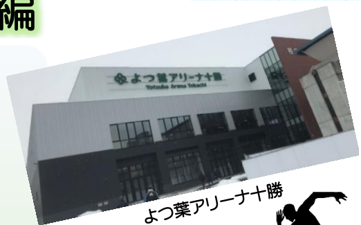
よつ葉アリーナ十勝

※FAXの場合は氏名(ふりがな)、年齢、性別、住所、電話・FAX番号を記入して送信