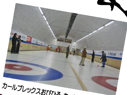
カールブックスおびひろ カーリングホール