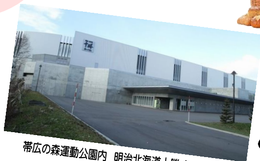
帯広の森運動公園内 明治北海道十勝オーバル