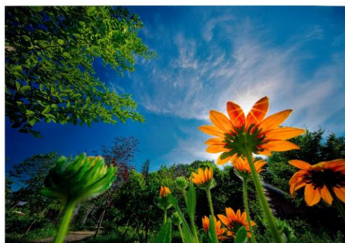
2017年 第5回 最優秀受賞作

好評につき今年もまたフォトコンテストを実施します!! 今回のテーマは「撮っておきの幕別」です。幕別の美しい風景を写真で表現してみませんか? フィルムカメラ・デジタルカメラはもちろん、携帯電話で撮影したものでもOKです!! お気軽にご応募下さい。