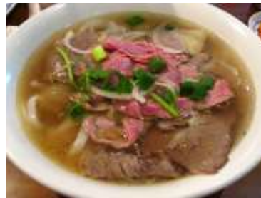
フォー (ベトナム料理)