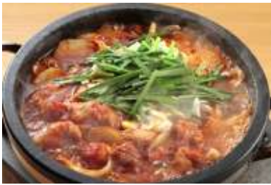
タッカルビ(韓国料理)

世界各国には、いろいろな美味しいお料理がたくさんあります。 今回の講座では、各国の講師をお招きして開講します。 料理を学び、食事と会話を楽しみながら外国文化に触れてみませんか？