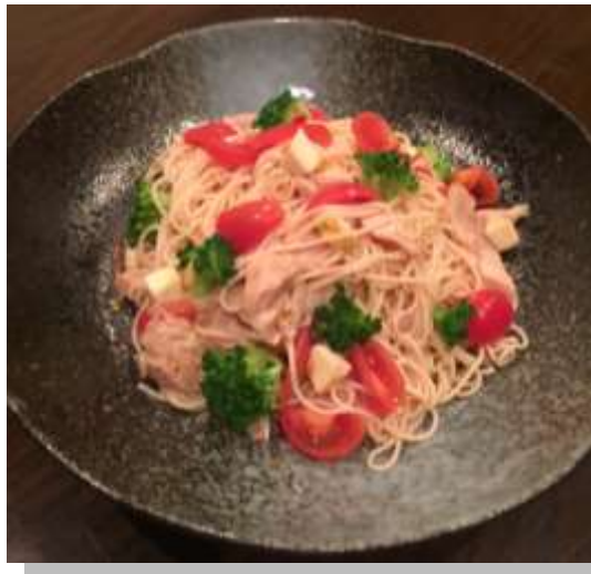
料理はイメージです