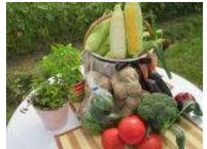
新鮮野菜がたっぷり！