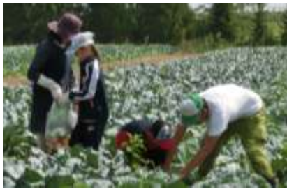
昨年の収穫体験の様子

夏は野菜がおいしい季節！採りたて野菜を使ってその場で本格中華を作ってみませんか？親子で参加をして夏休みの楽しい思い出を作りましょう！-